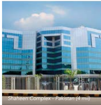
Shaheen Complex - Pakistan (4 mil)

☐ AC 4 mil Clear ☒ AC 7 mil Clear ☐ AC 8 mil Clear