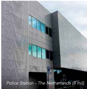
Police Station - The Netherlands (8 mil)

Armorcoat® est non réfléchitif et donc virtuellement invisible sur vos fenêtres, jour et nuit. Les couches de polyester hautement résistantes, les adhésifs extrêmement performants offrent une atténuation considérable des effets de l'éclatement et une très grande capacité de résistance aux impacts.